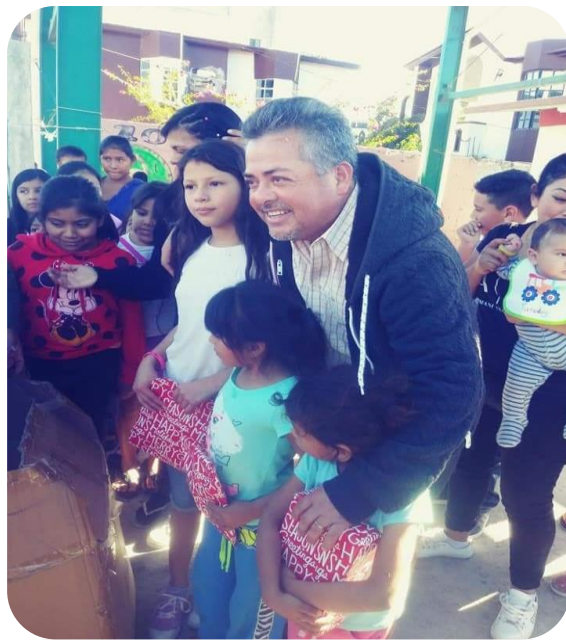
Apoyo a niños de bajos recursos de colonias de Reynosa