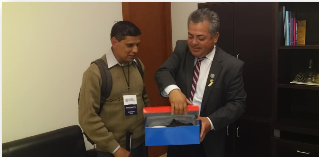
Entrega de zapatos deportivos a un deportista invidente