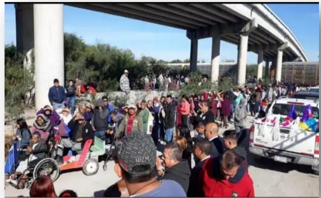
Entrega de despensas a habitantes de bajos recursos