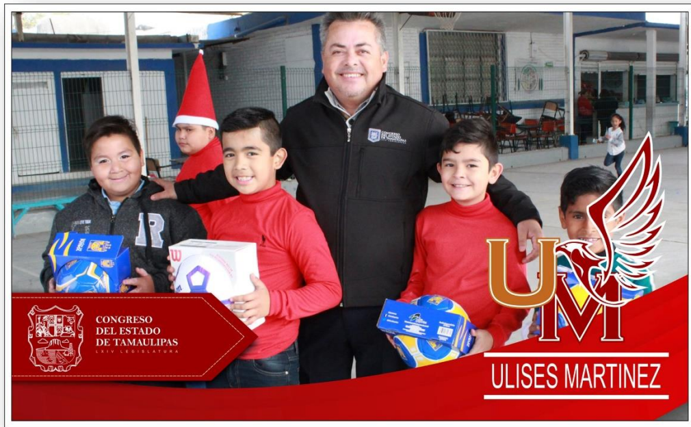
Entrega de material deportivo