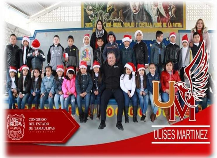
Apoyo en los festejos navideños a niñas y niños de educación básica