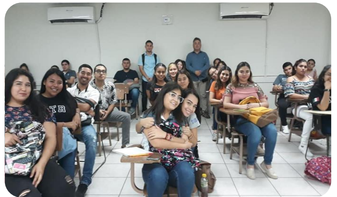
Vinculación con estudiantes de nivel Medio Superior y Superior