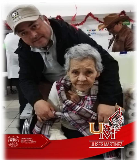
Apoyo a adultos mayores de bajos recursos