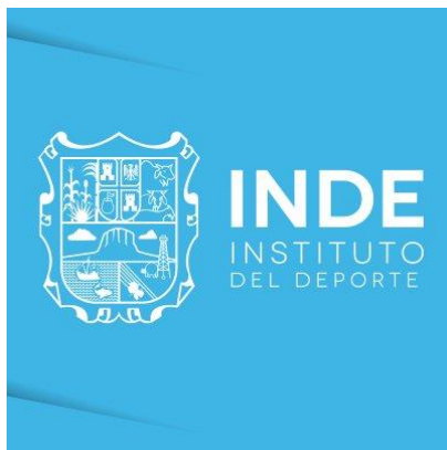
Instituto del Deporte