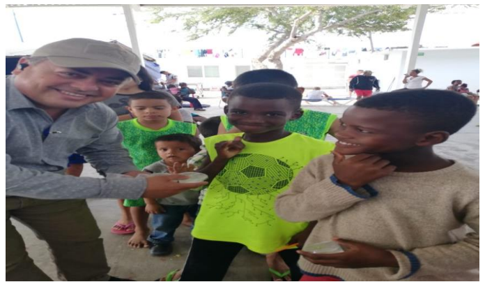
Ayuda humanitaria a inmigrantes establecidos en el municipio de Reynosa