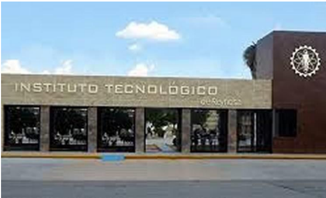
Instituto Tecnológico de Reynosa