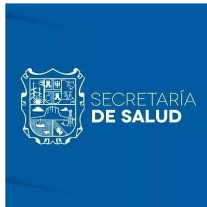
Secretaría de Salud