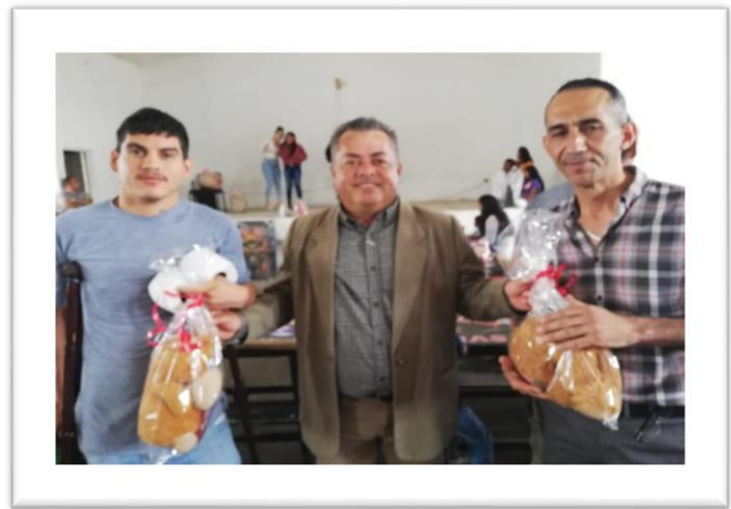
Apoyo a personas privadas de la libertad del CERESO de Reynosa